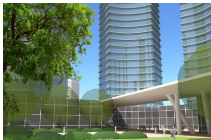
תכנון רב שכבתי: טיילת עילית במפלס הגגות מעל ככר עירונית

גינות גג ציבוריות יכולות לשרת את אוכלוסיות הדיירים בבניינים בהם הן מותקנות. האפשרות לרדת מדירת מגורך אל גינת הגג היא נוחה. ילדים יכולים לשחק בגינת הגג בלי להסתכן בירידה לרחובות.